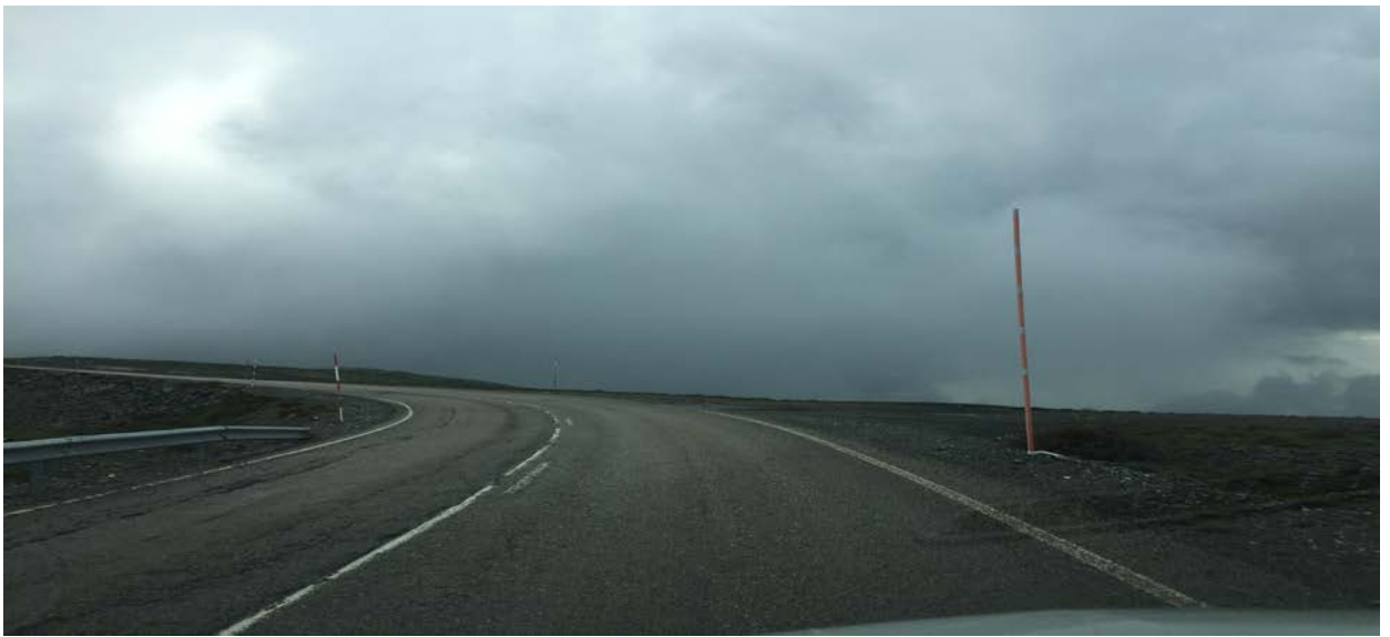
META. Km. 64,500. LE-726