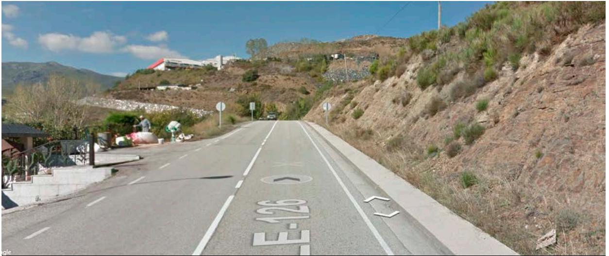
SALIDA. Km. 55,700. LE-726 Frente a la última casa saliendo de La Baña