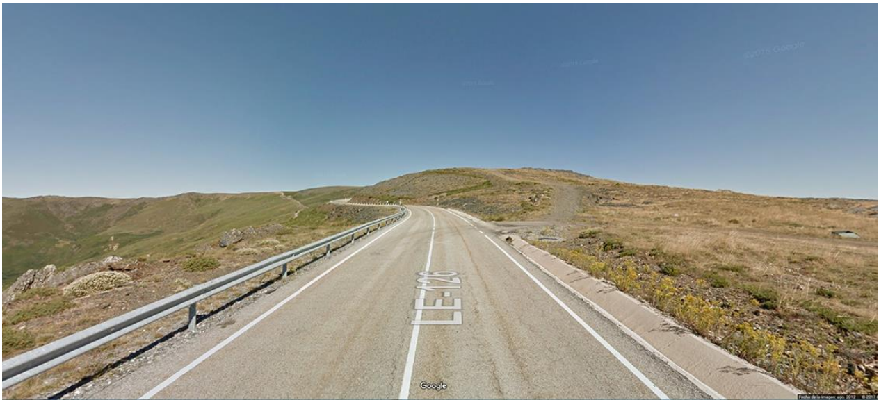
META. Km. 63,900. LE-726