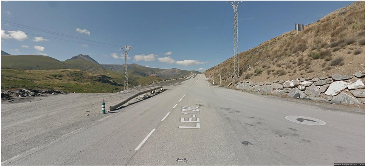
SALIDA. Km. 56,700. LE-726