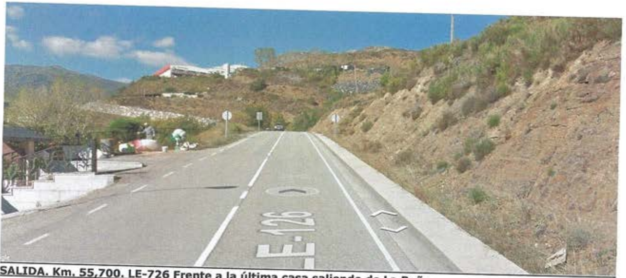
SALIDA. Km. 55,700. LE-726 Frente a la última casa saliendo de La Baña