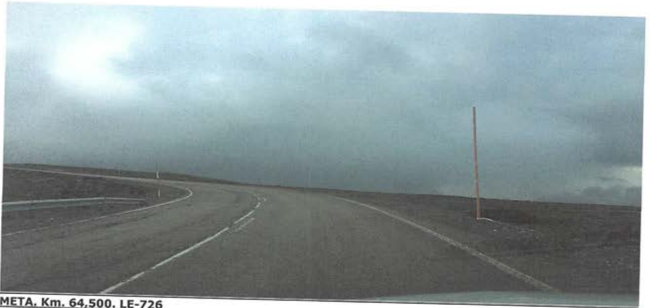
META. Km. 64,500. LE-726